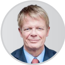
Reiner Hoffmann, Vorsitzender des Deutschen Gewerkschaftsbundes und Vorsitzender des Vorstands der Hans-Böckler-Stiftung Jahrgang 1955

Gelernter Groß- und Außenhandelskaufmann und Diplom-Ökonom