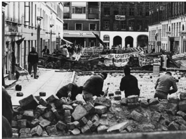
Barrikadenkämpfe um die Ryesgade, September 1986

Mittlerweile glichen die BZ'er fast einer Miliz, mit einheitlichen Arbeitsanzügen, schwarzen Helmen und ausgerüstet mit Schlagwaffen, Molotowcocktails und Zwillen. Und da sich nach der Befestigung der Ryesgade zudem ca. tausend Jugendliche dem Kampf anschlossen, gelang es, einem zweitägigen Polizeiangriff auf die Barrikaden im Quartier um die Ryesgade herum standzuhalten. Daraufhin ging der Konflikt erneut in eine politisch vermittelte Phase über, mit erneut aufgenommenen Verhandlungen und externen Akteuren, die die Krise zu lösen versuchten. Die harte Haltung sowohl der Regierung als auch der BZ'er