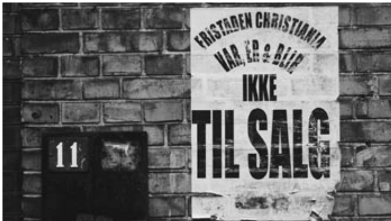
»Die freie Stadt Christiania war, ist, und bleibt nicht zu verkaufen.«

Damit sind wir wieder am Ausgangspunkt dieses Buches angelangt: Die Gentrifizierung des urbanen Lebens geht einher mit einer ideologischen Agenda, die angetreten ist, alle schiefen und unangepassten Winkel und Existenzen zu verdrängen, zumal wenn sie privatem Eigentum und freiem Markt vermeintlich oder tatsächlich im Wege stehen. Doch wie die Beiträge und Interviews in diesem Buch zeigen, hat der Zentralstaat auch diesmal die Proteste unterschätzt, die eine solche Politik unweigerlich auslöst. Es sind heute die sich vornehmlich außerhalb des Parlaments artikulierenden Proteste von Minderheiten, Flüchtlingen und MigrantInnen sowie die Bewegung für das Ungdomshuset und Christiania, die den genannten Zielen der Rechtsregierung entgegenstehen. Heute findet eine nicht in erster Linie durch offene Repression, sondern durch Preissteigerungen vermittelte »diskrete« Verdrängung alternativer Lebens- und Wohnformen statt. Kopenhagen ist eine der teuersten Städte der Welt, und es wird immer schwieriger, andere, nicht-kommerzielle Formen des Zusammenlebens zu praktizieren. In diesem Spannungsfeld liegen die wirklichen Ursachen für die sozialen Konflikte, die in der Stadt aufbrechen. Und hier werden zugleich die Grenzen der Möglichkeit deutlich, Menschen wie Gegenstände zu behandeln, die angekauft, verkauft und nach den Regeln des Marktes weggeschmissen werden können.